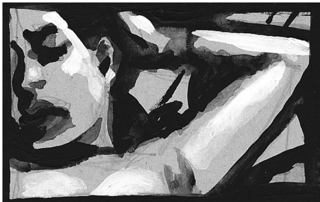
Rudy Trouvé / exposé à l'an vert du 15 fév. Au 09 mars